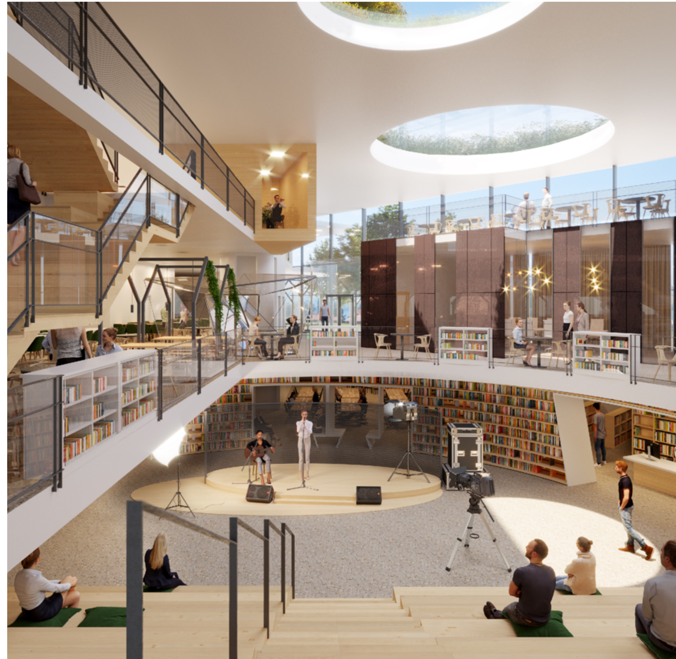
I DH skal det blant annet bygges en ny campus - med spennende åpne planløsninger.