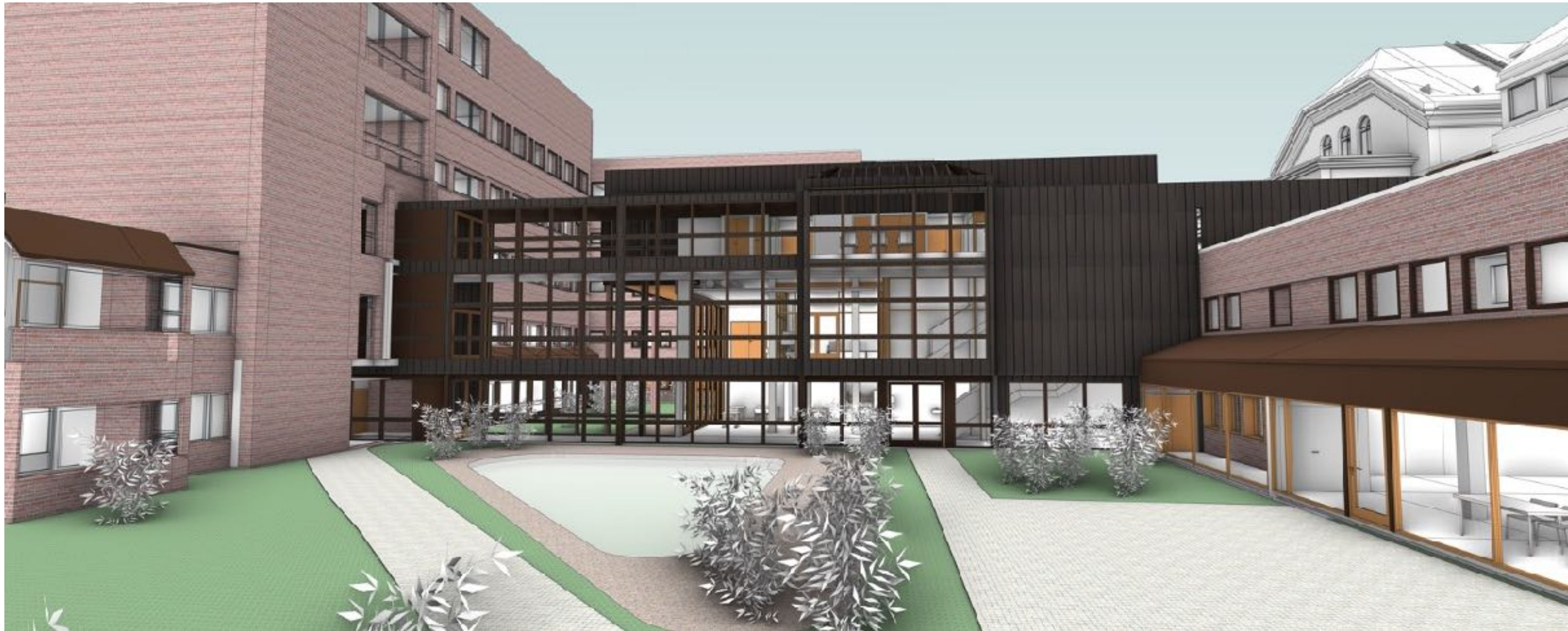
G-fløy sett innenfra atriet på sykehuset (mot vest).

En dobling av sykehusets radiologiske kapasitet er en forutsetning for å realisere sykehusets muligheter for vekst framover. Ny G-fløy åpner også muligheten for å gjennomføre andre bygningsmessige endringer på lengre sikt som vil gi bedre logistikk og pasientflyt.