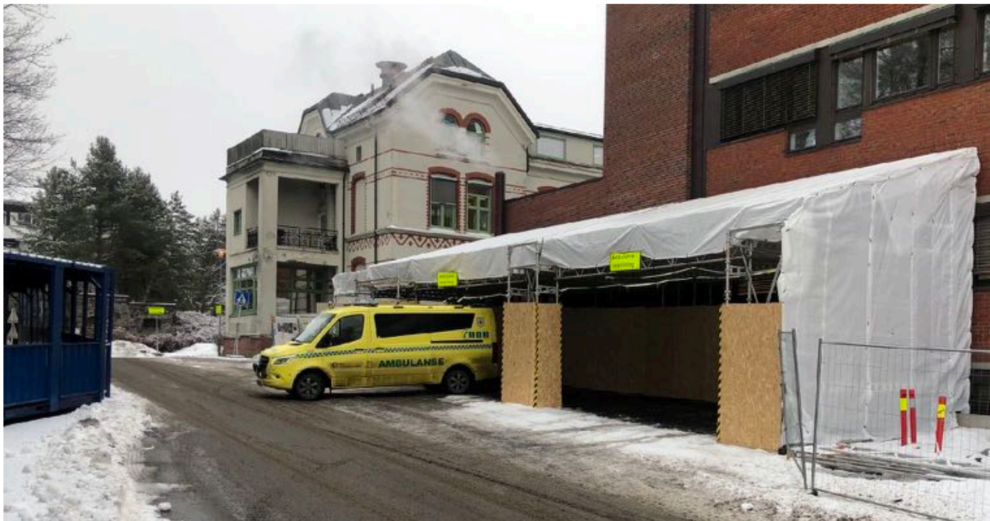
Midlertidig ambulanse-oppstilling mens byggearbeidene pågår.