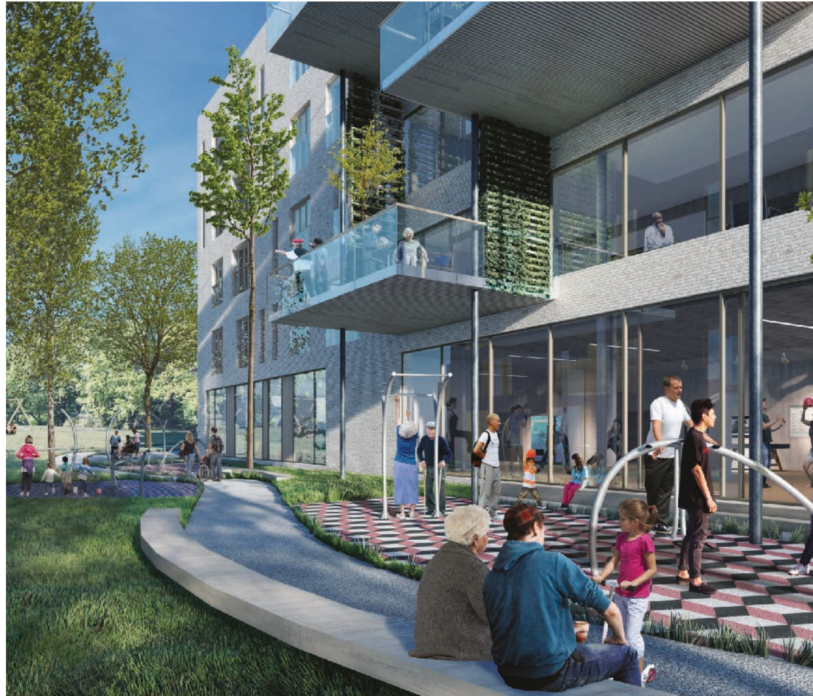
Slik ser arkitektene for seg at et nytt sykehjem kan se ut.