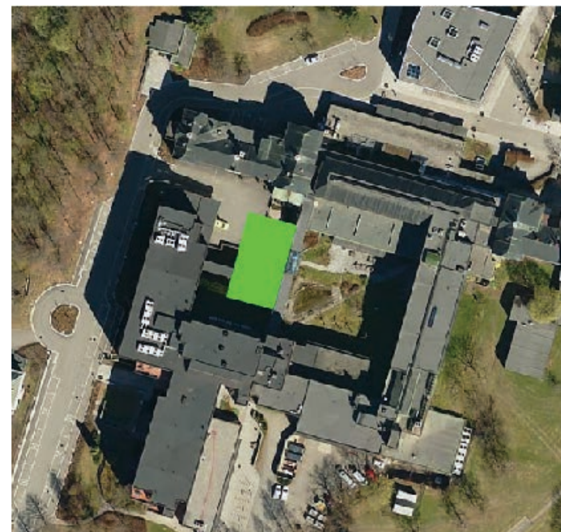
Sett ovenfra - G-fløy merket grønt.